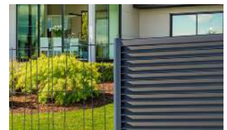
P.82 - Poteau Argo Connect