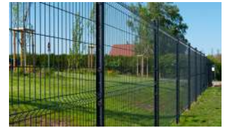
P.74 - Panneau Argo