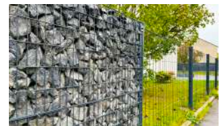
P.104 - Clôture gabion